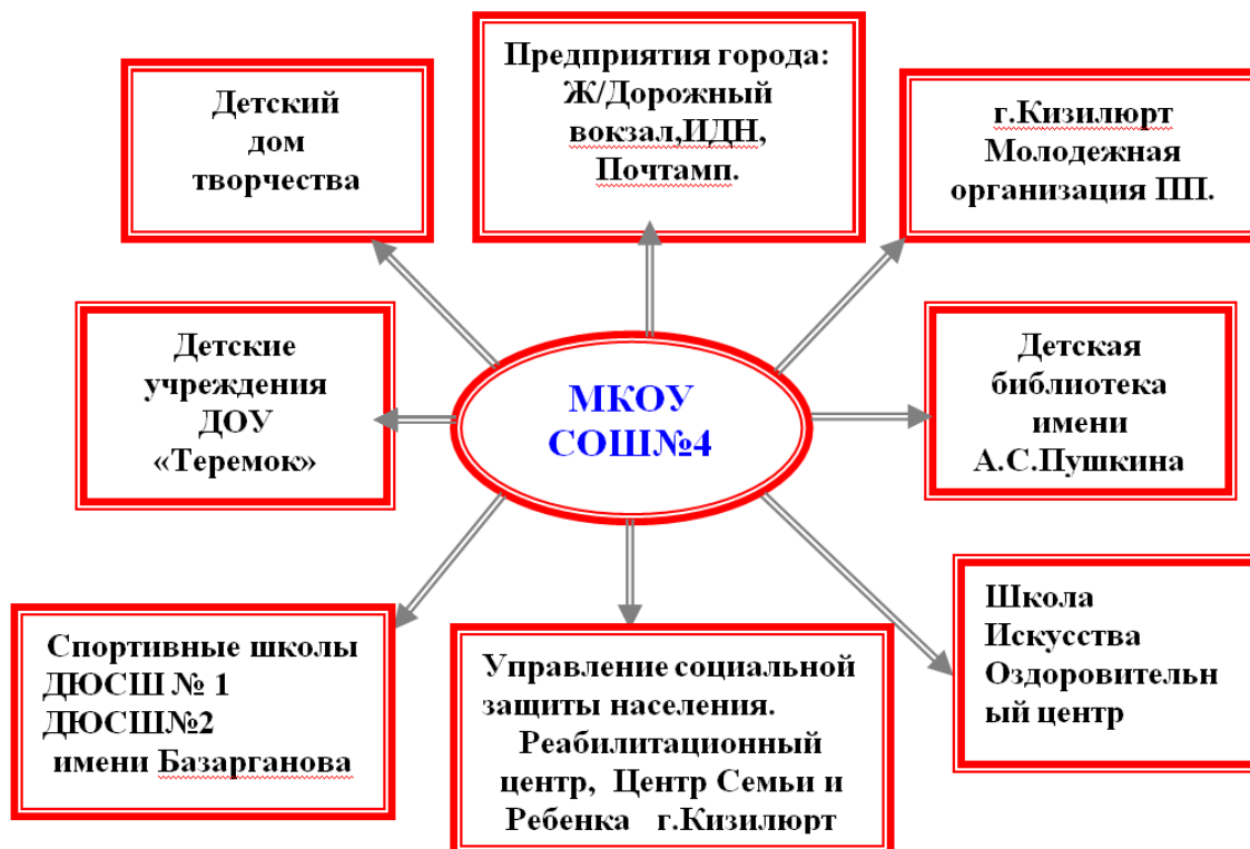
Схема партнёрских связей МБОУ СОШ № 4 г.Кизилюрт

С момента открытия школа никогда не стояла на месте, она развивалась, укрепляла свои позиции, общественные и деловые связи. В настоящее время школа сотрудничает с административными органами, различными общественными организациями, органами образования.