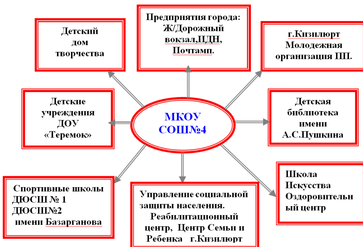
Схема партнёрских связей МКОУ СОШ № 4 г.Кизилюрт

С момента открытия школа никогда не стояла на месте, она развивалась, укрепляла свои позиции, общественные и деловые связи. В настоящее время школа сотрудничает с административными органами, различными общественными организациями, органами образования.